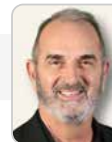
Gilles RUS Événementiel