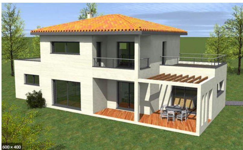
Exemple d'insertion pour une maison neuve

PCMI 6,7,8 : Insertion photographique Le document graphique est une représentation de l'insertion du projet qui fait l'objet de la demande au sein de son environnement immédiat. (Illustration graphique du projet, tel qu'il sera à la fin des travaux). Ce plan doit faire apparaître non seulement le projet tel qu'il sera à l'issue des travaux, mais aussi les constructions déjà bâties lorsqu'elles existent, et si possible, les constructions voisines.